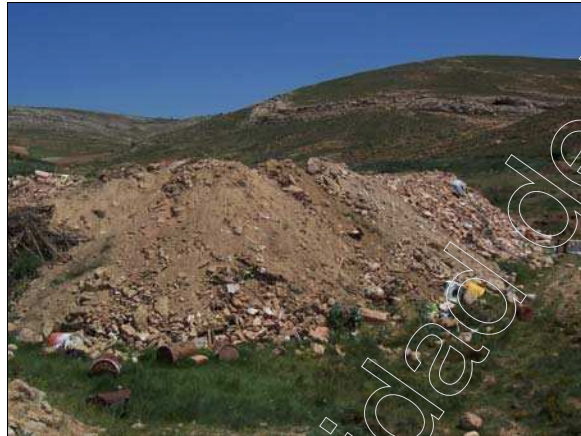
Fig. 14 Escombrera

La única zona que se encuentra en el término de Cañada Vellida pudiendo ser definida como “zona degradada” debido al impacto visual y paisajístico que ocasiona, es donde se han estado depositando a lo largo del tiempo todos los escombros y “trastos viejos” de la localidad, esto se localiza en el camino de la vía.