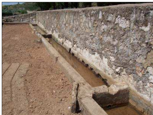
Fig.5 Fuente de San Juan

También la localidad dispone de fuentes, que son abastecidas por agua debidamente tratada, entre estas podemos localizar: