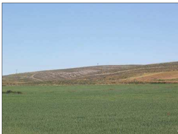
Fig. 12 Sierra Costera