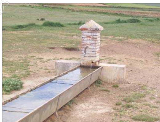
Fig. 1 Fuente de los Cabezos