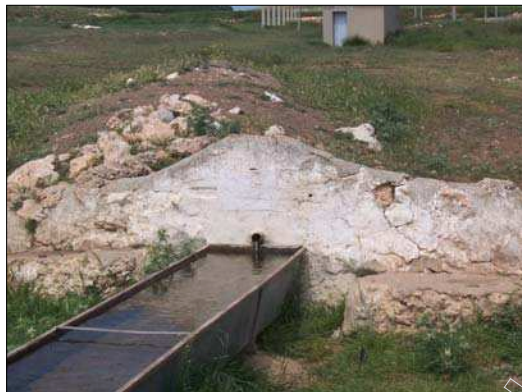
Fig. 2 Fuente de la Sierra