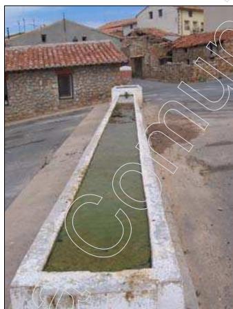
Fig. 6 Fuente de San Miguel