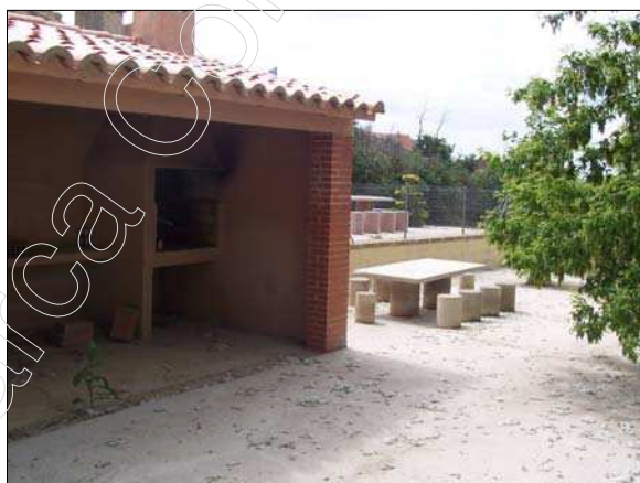
Fig. 13 Merendero de la Fuente Vieja

El merendero ubicado en la Fuente Vieja cuenta con las infraestructuras perfectamente seleccionadas para el uso del mismo, así mismo la zona ocupada por los elementos que componen el merendero (mesas, sillas y caseta con fogones) se encuentra asfaltado, dando comodidad para el acceso al mismo y facilitando su limpieza.