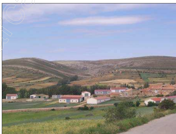
Fig 11 Vista de la Sierra de la Solana y del barranco del Hocino

Con respecto a las zonas más elevadas, destaca la Sierra de la Costera , ubicada en dirección a la localidad de Galve, la Sierra de la Solana , cuya vegetación más característica es el denominado monte bajo y El Pedracho , lugar cuyo interés natural es debido al bosque de coníferas que en él se desarrolla.