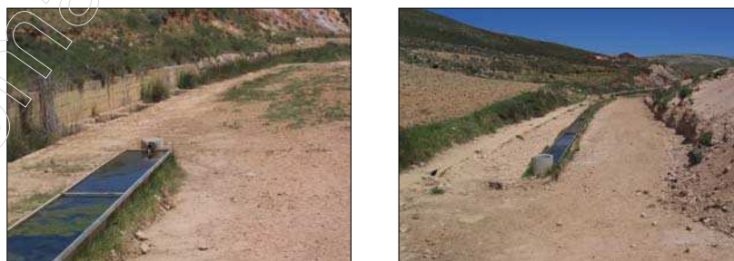
Fig. 4 Fuente El Tunel