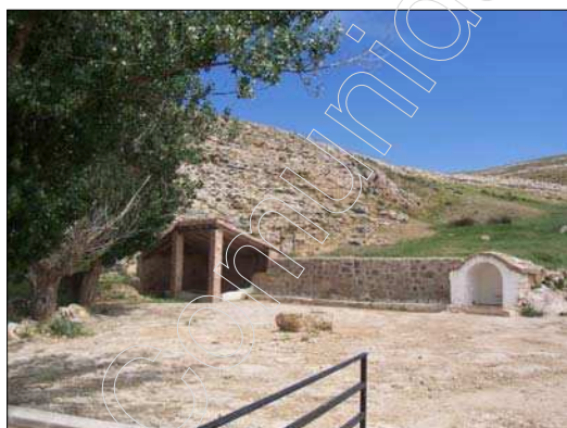
Fig. 3 Fuente Vieja