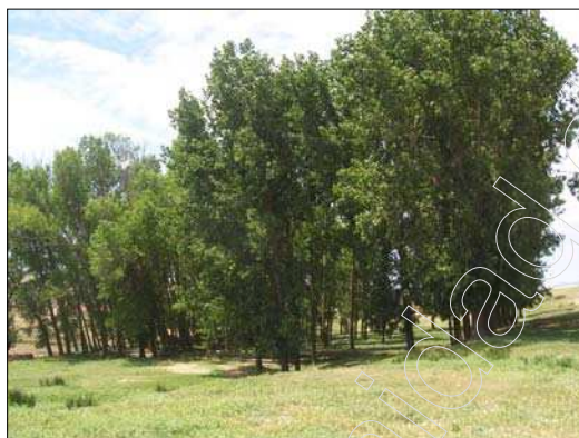
Fig. 7 Chopera

Debido a la existencia de cauces superficiales, también se encuentran pequeños grupos de vegetación de ribera, con especies arboladas comunes como son el chopo ( gén. Populus ), entre estos se desarrollan especies de porte más bajo, también típicas de zonas de abundante disponibilidad hídrica, como son sargas ( Salix eleagnos ), zarzas ( Rubís fruticosus ), etc.