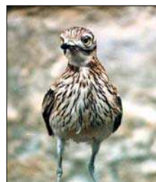
Fig.10 Burhinus oedicnemus (alcaravanes)

Entre los mamíferos de esta zona se encuentran ardillas ( Sciurus vulgaris ), tejón ( Meles meles ), garduña ( Martes foina ), lirón careto ( Eliomys quercinus ), ratón de campo ( Apodemus sylvaticus ), conejo común ( Oryctolagus cuniculus ), liebre común ( Lepus capensis ), gineta ( Genetta genetta ),