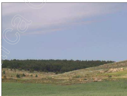
Fig. 8 Vista El Pedracho

La vegetación de monte se reduce a la localizada en el monte El Pedracho, cuyo elemento dominante en el estrato arbolado es el pino negral ( Pinus nigra ), el pino negral se desarrolla muy bien sobre los sustratos calizos, resistiendo las duras condiciones de montaña seca que existen en este término.