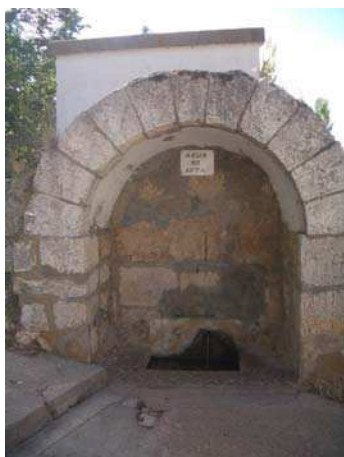
Figura.1 Fuente Un Caño

En el término de Perales de Alfambra se encuentran varias fuentes como la fuente de un caño, fuente dos caños, en el núcleo urbano; la fuente del Tío Andrés, Los Chorrillos y el vallejo las Porras en la Cañada; etc.; y balsas y abrevaderos para el ganado.