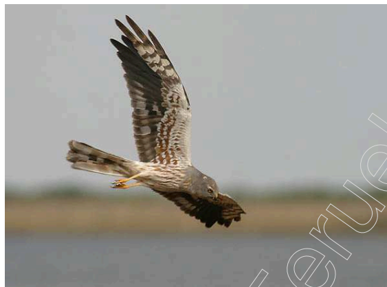
Figura 5. Aguilucho pálido ( Circus cyaneus )

La Ganga Ortega ( Pterocles orientalis ) está catalogada desde el 5 de abril de 1990, según Real Decreto 439/1990 como especie de Interés Especial y la Alondra Dupont ( Chersophilus duponti ) está catalogada como especie sensible a la alteración de su hábitat.