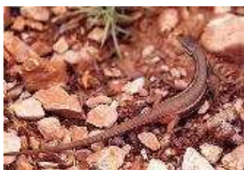
Figura 10: lagartija colilarga

Los reptiles que se encuentran en el municipio son lagartija ( Lacerta murafis ), lagartija colilarga ( Psammodromus Algius ) y el lagarto ( Lacerta lepida ). El otro orden presente es el de los ofidios, como la culebra de agua (gen. Natrix ) y la culebra lisa europea ( Coronella austriaca ) catalogada de Especial Interés.