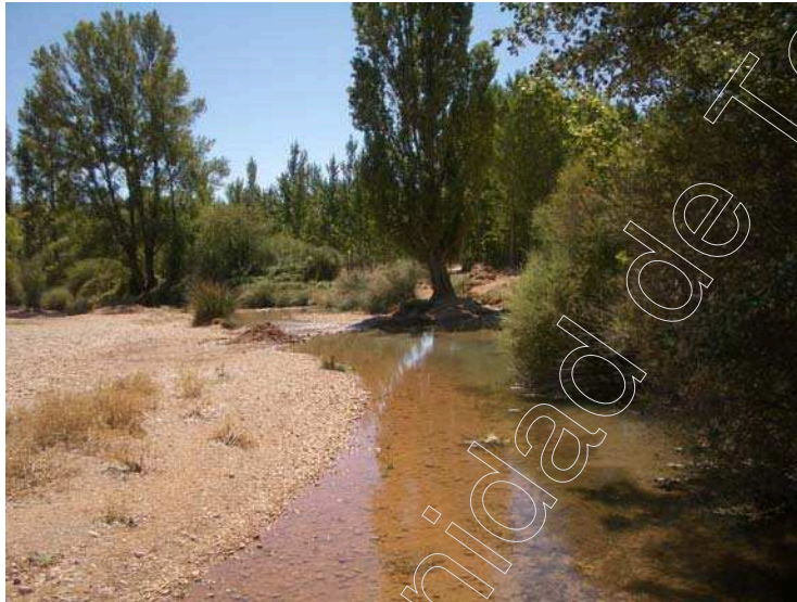
Figura 14: Río Alfambra

Destaca en el paisaje las frondosas choperas que acompañan en su travesía al río Alfambra, dando lugar a un paraje con hermosas vistas y de gran tranquilidad.