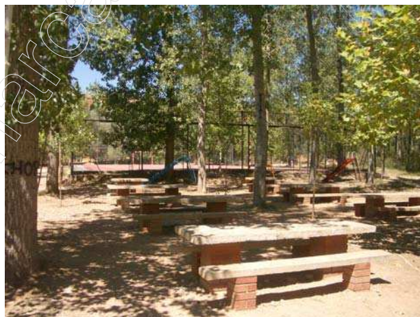
Figura 15 . merendero de la Ribera del Río Alfambra.

A la derecha del camino entre una chopera se ubica un merendero equipado con doce fogones, ocho mesas, una zona recreativa con tres toboganes para los niños y una pista de fútbol.