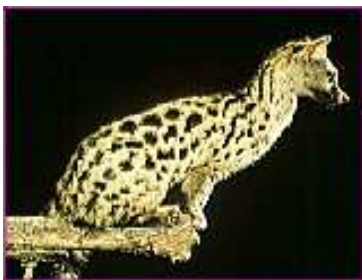
Figura 8: la gineta