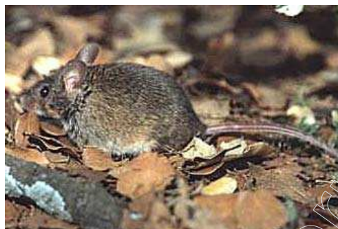
Figura 9: ratón silvestre

Los reptiles que se encuentran en el municipio son lagartija ( Lacerta murafis ), lagartija colilarga ( Psammodromus Algius ) y el lagarto ( Lacerta lepida ). El otro orden presente es el de los ofidios, como la culebra de agua (gen. Natrix ) y la culebra lisa europea ( Coronella austriaca ) catalogada de Especial Interés.