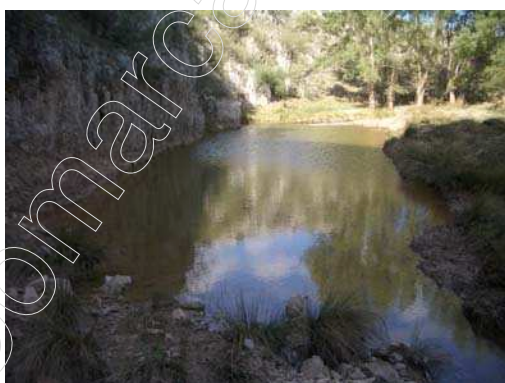
Figura 19: río Alfambra

La vegetación de la zona es vegetación de Ribera al lado de los pozos formada por juncos, zarzas y chopos que acompañan al camino que une los distintos pozos; alrededor de todo el paraje la vegetación son matorrales de tomillo, espliego, erizal, etc.