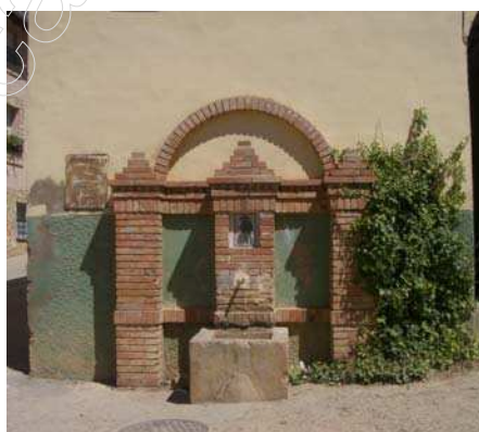
Figura 3. Fuente de Villalba Alta

Al noreste del término de Perales del Alfambra, donde el río Alfambra acomoda su cauce a la dirección tectónica de la depresión de Teruel hasta su confluencia con el Guadalaviar, se ha considerado esta zona, en el Plan Energético Nacional como reservado al Estado para uso hidroeléctrico.