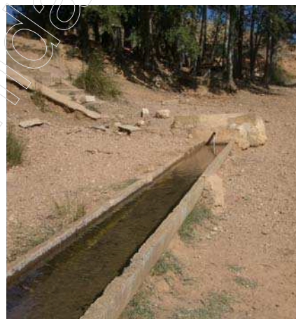
Figura 2 . Fuente del Tío Andrés