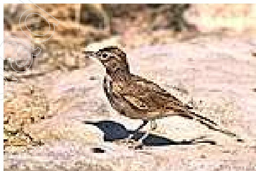
Figura 7. Alondra Dupont

Otras especies de aves que habitan en el territorio son el águila perdicera ( Hiraeetus fasciatus ), el águila culebrera ( circaetus gallicus ), el alcotán ( Fa/co subbuteo ), el mochuelo ( Athene noctua ), la lechuza común ( fyto alba ), búho real ( Bubo bubo ), el cuervo ( Corvus corax ), la graja ( Corvus corone ), la pícaraza ( Pica pica ), el estornino ( Sturnus vulgaris ), el tordo negro ( Stumus vufgaris ), la tórtola turca ( Súeptopelia decaocto ), la golondrina común ( Hirundo rustica ), el vencejo común ( Apus apus ), el abajaruco ( Merops apiaster ), la abubilla ( Apupa epops ), la alondra común ( Alauda arvensis ), el gorrión común ( Passer domesticus ), el gorrión chillón o chillandra ( Passer petronia ), el triguero ( Emberiza calandra ), el jilguero ( Calduelis calduefis ), el pardillo común ( Acanthis cannabina ), el petirrojo ( Erithacus rubecufa ).