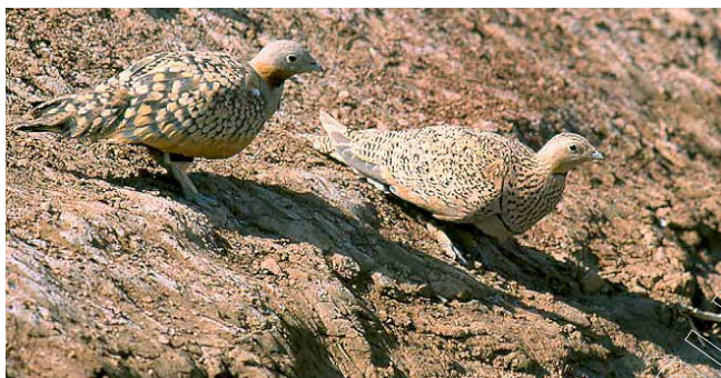
Figura 6. Ganga ortega

La Ganga Ortega ( Pterocles orientalis ) está catalogada desde el 5 de abril de 1990, según Real Decreto 439/1990 como especie de Interés Especial y la Alondra Dupont ( Chersophilus duponti ) está catalogada como especie sensible a la alteración de su hábitat.