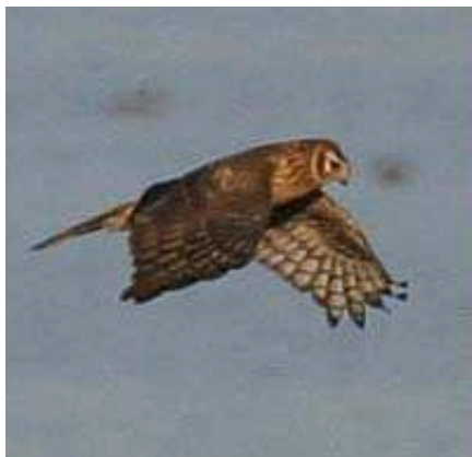
Figura 4. Aguilucho Cenizo ( Circus pygargus )