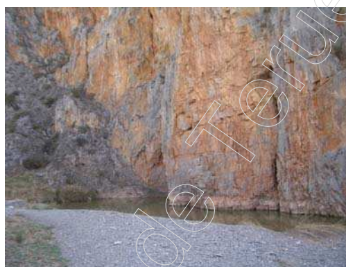
Figura 20 y 21: Paredes de los pozos.