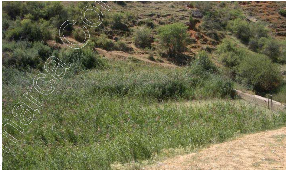
Figura 13: Paisaje del Torrmagal.

El paisaje predominante en la zona es vegetación ríparia: grandes choperas, zarzas, juncos, etc. Alrededor de la fuente hay plantaciones de maíz y pequeñas huertas.