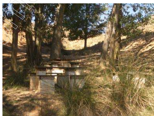
Figura 22: merendero de La Cañada

Al lado de la piscina hay un proyecto de replantación de chopos.