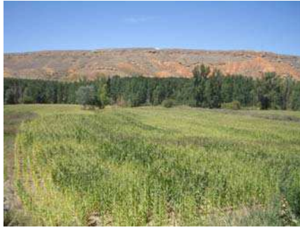
Figura 12. Paisaje de Villalba Alta