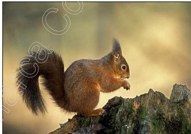
Figura 7: ejemplar de ardilla