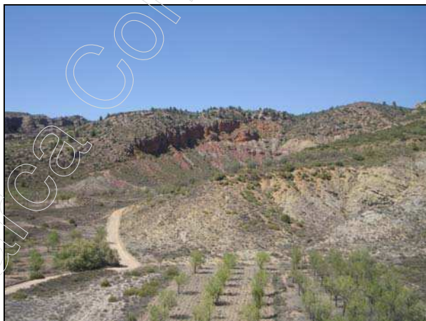
Figura 8: paisaje de Tramacastiel

La vegetación que predomina en el paisaje es la típica de suelos poco profundos y climas continentales secos, donde las precipitaciones son escasas, y no dejan que se desarrollen extensas masas vegetales.