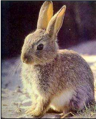
Figura 5: ejemplar de conejo

Entre los mamíferos destaca la presencia de especies cinegéticas, como son el jabalí ( Sus scrofa ), conejo común ( Oryctolagus cuniculus ), y liebre común ( Lepus capensis ). Debido a la presencia de estas especies, junto con otras también cinegéticas, en el término existe un coto de caza.