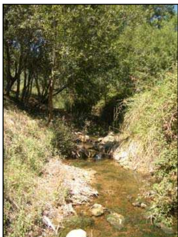
Figura 2: arroyo El Regajo de Tramacastiel

La red hidrológica de este municipio presenta un carácter descendente de oeste a este, desde la Sierra de Albarracín hasta la depresión del valle del Turia. Está formada por distintas ramblas y barrancos, pertenecientes a la Confederación Hidrográfica del Júcar. Buena parte del término coincide con la cuenca del arroyo conocido como “Regajo de Tramacastiel”, que nace en la zona norte del municipio, y desagua al río Turia, en el término municipal de Mas de Jacinto.