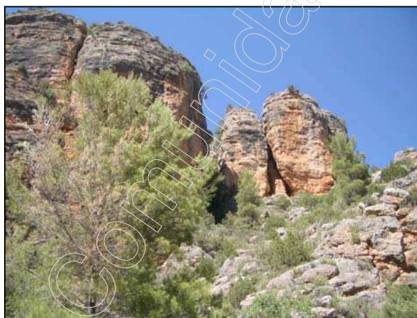
Figura 9: Barranco de La Hoz

En las laderas del barranco está vegetación cambia, debido a que el aporte de agua en el suelo no es suficiente para su desarrollo. Esta vegetación se ve sustituida por especies de suelos poco profundos y ambientes secos, que crecen conformando un monte bajo, como son aliagas, enebros, sabinas y distintas aromáticas (tomillo, romero, salvia, manzanilla,...)