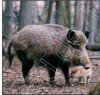
Figura 6: ejemplar de jabalí