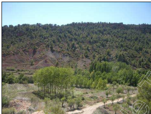
Figura 3: vegetación del municipio

( Prunus prostata ), espino rastrero ( Rhamnus saxatilis ), hiedra ( Hedera helix ), y algunos rosales ( Rosa sp.).