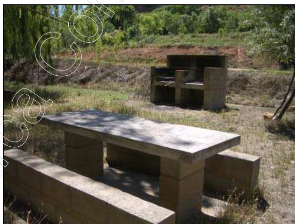
Figura 10: merendero de Tramacastiel

En el barrio de Mas de la Cabrera existe otro merendero, también ubicado en la ribera, y equipado con mesas, fogones, fuentes y columpios; la vegetación que rodea este entorno está formada principalmente por chopos.